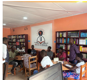
Photo des élèves

Le 29 mars 2023, notre organisation a entamé un partenariat pour la construction d'un hub éducatif avec le Lycée Moderne d'Anyama. Ce partenariat nous a permis de mettre en place un hub éducatif au sein de l'école, doté de 3000 livres et de 24 ordinateurs. Depuis notre ouverture, nous travaillons en collaboration avec les élèves du lycée afin de développer des initiatives et des programmes éducatifs axés sur l'amélioration des compétences en littératie et en numérique. Dans le but d'élargir nos initiatives et d'accroître notre impact, nous nous sommes engagés à organiser le tout premier programme de vacances pour les élèves de la communauté d'Anyama, afin de leur offrir des vacances enrichissantes, agréables et mémorables.